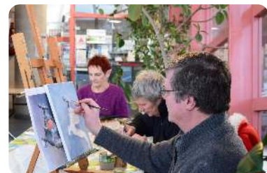
Exposition d'œuvres Vendredi 30 janvier