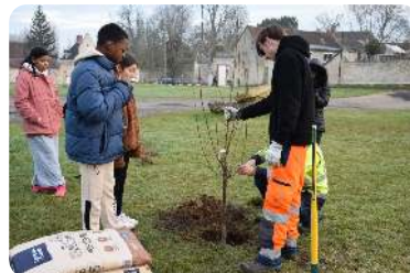
Sensibilisation à l'écologie Lundi 19 janvier

L'épisode neigeux qui a touché le nord-ouest de la France début janvier, n'a pas épargné notre ville. Les agents ont activé leur plan de déneigement pour assurer la sécurité des Maxipontains. Une grande partie des services techniques de la ville ont donc été mobilisés pour saler les routes et les différents espaces publics.