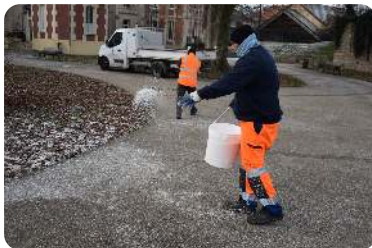
Les agents mobilisés Vendredi 5 décembre

L'épisode neigeux qui a touché le nord-ouest de la France début janvier, n'a pas épargné notre ville. Les agents ont activé leur plan de déneigement pour assurer la sécurité des Maxipontains. Une grande partie des services techniques de la ville ont donc été mobilisés pour saler les routes et les différents espaces publics.