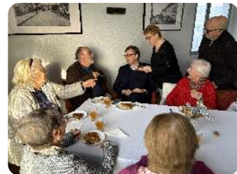
Galette des rois à la RA Jeu

Les éco-délégués de l'école Fabre d'Eglantine se sont improvisés jardiniers. Aidés des agents des espaces verts de la ville, ils ont planté 23 arbres à proximité de leur établissement. Des pommiers, poiriers, cerisiers, cognassiers, noisetiers, mais aussi des charmes et tilleuls, offerts par la Fédération des chasseurs des Hauts-de-France.