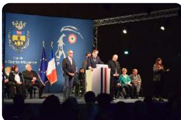
Cérémonie des vœux Samedi 24 janvier

Quoi de mieux que la traditionnelle galette des rois pour partager un moment convivial ? Le maire a profité de cette rencontre gustative pour souhaiter ses vœux aux résidents de L'Age d'Or. Cinq reines et rois ont ainsi été couronnés. Ils ont reçu une petite surprise qui n'a pas manqué de faire son effet.