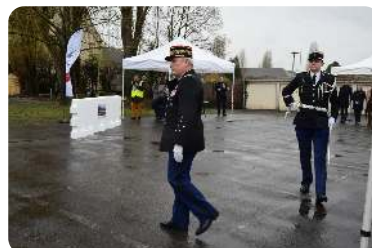
Pose de la première pierre de la gendarmerie Mardi 27 janvier